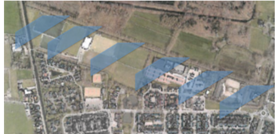
boven: plangebied onder: Sport en Cultuurcentrum De Camp