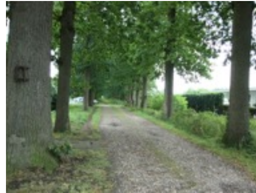
Recreatieve route over het landgoed