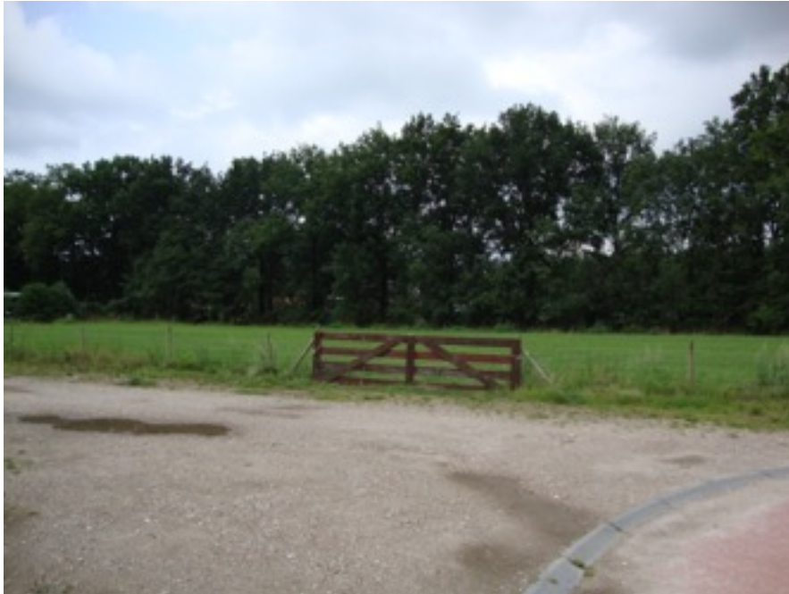
Het Groene Woud grenst aan het slagenlandschap