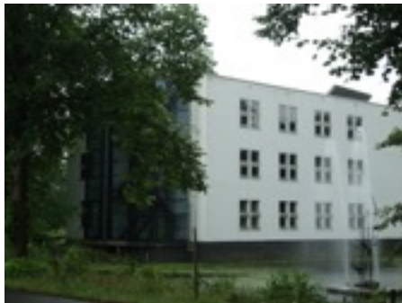
Voormalig kantoorpand en mogelijke nieuw verbinding naar het landgoed

Aan de noordelijke entree van Woudenberg staat op de hoek van de J.F. Kennedylaan en de Geeresteinselaan een kantoorpand dat al geruime tijd leeg staat. De eigenaar is voornemens de functie van het pand te wijzigen in 'wonen' ten behoeve van twaalf appartementen. Aan de noordzijde van dit pand ligt het landgoed Geerestein. Het voormalige kantoorpand staat hiermee in verbinding door middel van een brug. Vanaf hier is een wandel- en fietsgebied over het landgoed bereikbaar.