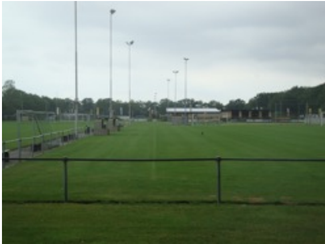
Sportvelden groene overgang naar het buitengebied

De gemeente heeft kennisgenomen van de visie voor het landgoed Geerestein en spreekt haar waardering hiervoor uit. Onderdelen van de visie kunnen zondermeer worden ondersteund zoals de versterking van het landgoed met haar omgeving. Andere onderdelen dienen nader te worden uitgewerkt of onderbouwd. Voor de kernrandvisie is van belang dat de voorgenoemde ontwikkeling aansluit om de ambitie om het dorp met het landschap te verbinden. De omzetting van de kantoorfunctie naar appartementen wordt door de gemeente ondersteund, mede omdat onderdeel van dit plan is om een publieke verbinding te maken met het achterliggende landgoed.