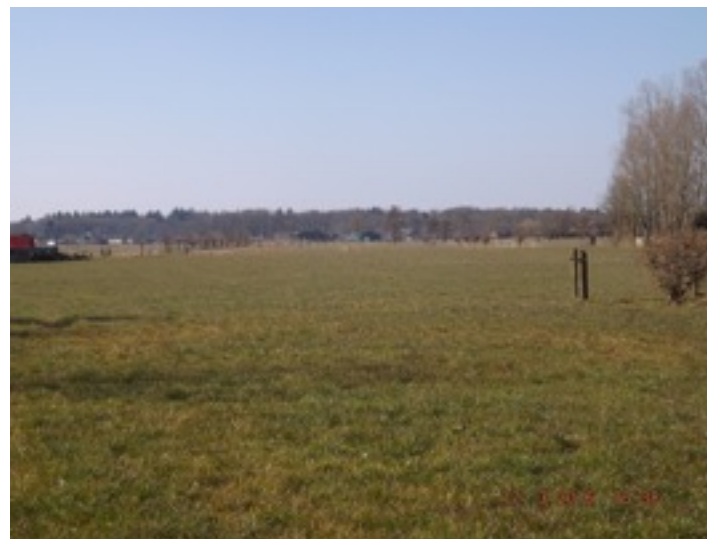
boven: Slagenlandschap met op de achtergrond de Utrechtse Heuvelrug onder: Kampenlandschap gaande Brinkkanterweg

De gemeente heeft in haar groenbeleidsplan uitgesproken dat het voor het behoud van het groene karakter van Woudenberg erg belangrijk is dat “beeldbepalend privégroen behouden blijft en dat bij nieuwe ontwikkelingen de hoeveelheid groen niet verder afneemt. Ook dient de identiteit van het landschap behouden te blijven. Hetgeen ondermeer betekent het handhaven en ontwikkelen van de oude verkavelingstructuur zoals slagen- en kampenlandschap. Daarnaast streeft de gemeente ernaar om de groenstructuur in het dorp met het buitengebied te verbinden.