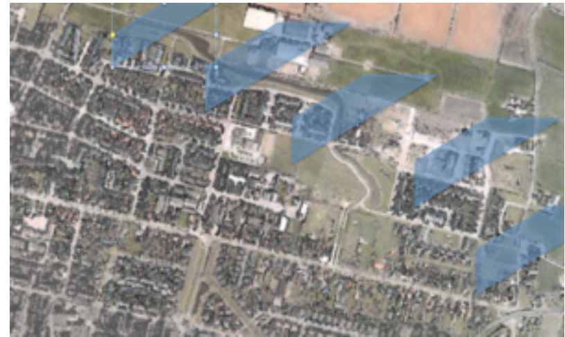
boven: plangebied onder: afronding Het Groene Woud

Aan de noordzijde grenst deze wijk aan een fraai landschap met een sterk oostwest gerichte verkaveling, dat ruimtelijk gestalte krijgt door soms monumentale lanen. Opvallend in dit gebied is een groot manege complex. Bij de ontwikkeling en inrichting van de wijk is rekening gehouden met de functie die het heeft als overgang van dorp naar het buitengebied. Zo is het buitengebied zichtbaar door openingen tussen de bebouwing en via de waterpartijen.