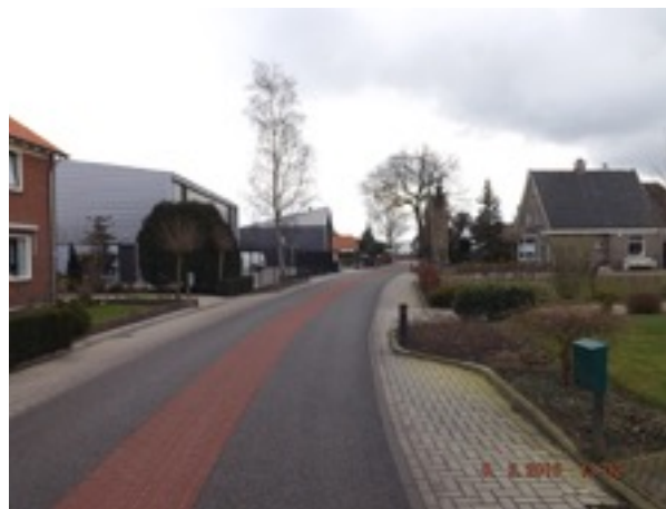
Laagerfseweg als toegang naar het buitengebied

De ontwikkeling van het bedrijventerrein aan de Landaasweg vindt nu redelijke autonoom plaats. In beginsel is dit op zich niet bezwaarlijk mits bij de invulling van de zuidelijke rand van het gebied rekening wordt gehouden met het aangrenzende kampenlandschap.