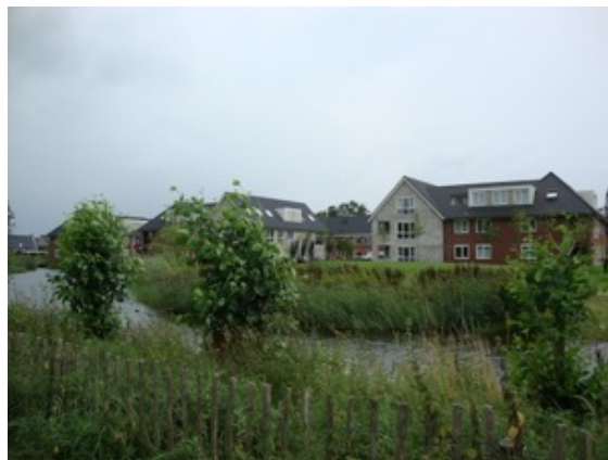
Inpassing Het Groene Woud in het landschap

Het maken/afroeden van een recreatieve route aan de noordzijde Behoud landschappelijk karakter Zegheweg Inpassing woonwijk Hoevelaar in het omliggende slagenlandschap. Behoud en versterking van de bestaande woon- werk 'enclave' in de zuid west hoek van het gebied Hoevelaar.