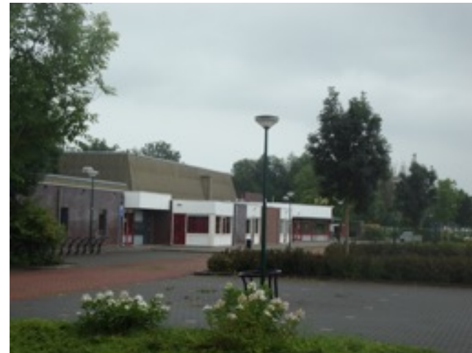
boven: Inpassing bebouwing onder: kans tot ontsluiting landgoed