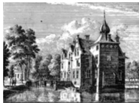
IN RIDDER HOFSTAD GROENEWOUD, onder WOUDEBEERD, geschild.

Dit initiatief bestaat reeds een lange periode waarbij het meest recent ingediende plan qua opzet en uitwerking veel realistischer dan is de voorgaande plannen. Het heeft dan ook potentie mits het goed en zorgvuldig verder wordt uitgewerkt en historisch wordt onderbouwd. Vooralsnog heeft de gemeente zich nog niet aan het initiatief gecommitteerd, maar biedt het mogelijkheden voor de toekomst. Nieuwe initiatieven in dit gebied dienen: nadrukkelijk een bijdrage te leveren aan een recreatieve verbinding tussen het dorp en het achtergelegen buitengebied.