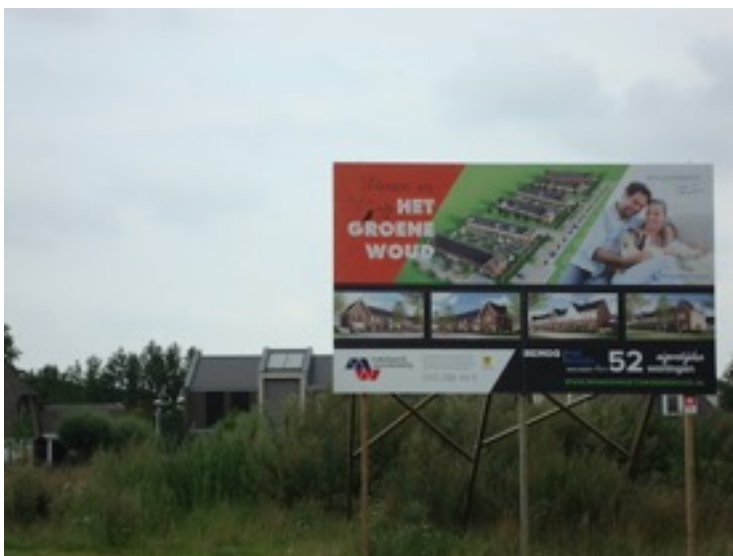
boven: Het Groene Woud onder: manege