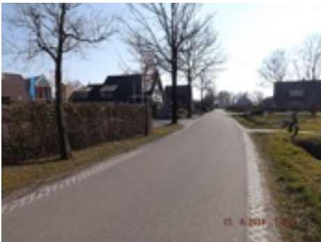
De Zegeweg als landelijke weg en te versterken cluster

De in ontwikkeling zijnde kleinschalige woonwijk Prinses Amaliaaan vormt de nieuwe rand van het dorp aan het buitengebied. De wijk is ruim van opzet en kent door de ruime kavels waarop vrijstaande en in beperkte mate twee onder een kap woningen zijn toegestaan een transparant karakter. Het buitengebied is vanuit deze wijk zeer goed zichtbaar.