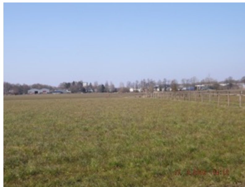
Boven: zicht vanaf de Brinkkanterweg op de bedrijfsbebouwing Onder: Geen doorzichten naar het landschap vanaf de Stationsweg Oost