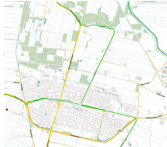
Nieuwe recreatieve paden sluiten aan het fietspaden structuur