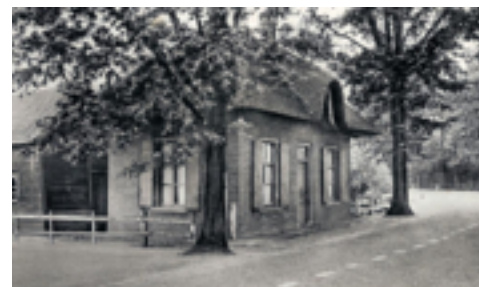
Het voormalig tolhuisje aan de Zeisterweg

Aan de Griftdijk is ook de voormalige provinciale werf gelegen. Deze werf is momenteel in eigendom van de gemeente. Ten zuiden van deze werf is het bouwbedrijf Morren gevestigd en direct ten noorden het sierbestratingsbedrijf LAWO. Ten noorden van de straat de Meent is Stuivenberg Tuinmachines gevestigd. Deze bedrijven tasten mede door hun omvang het woonkarakter van het gebied aan.