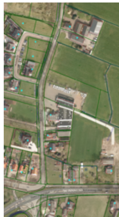
links: lintbebouwing langs de Zegeweg

locaties Het Groene Woud en Hoevelaar opgenomen. Desalniettemin vormen zij het overgangsgebiedje tussen beide locaties, omdat er een kleine 'oorspronkelijke lint aan diverse bebouwing tussen twee nieuwbouw wijken blijft bestaan. Dit lint bepaald mede de cultuurhistorische waarde van de Zegeweg. De Zegeweg is naast een belangrijke cultuurhistorische waarde een belangrijke recreatieve route die naar het buitengebied leidt. Het landschap kenmerkt zich ter plaatse door een strokenverkaveling. Kenmerken daarvan zijn nog aanwezig doordat langs enkele oude perceelsgrenzen rijen knotwilgen staan.