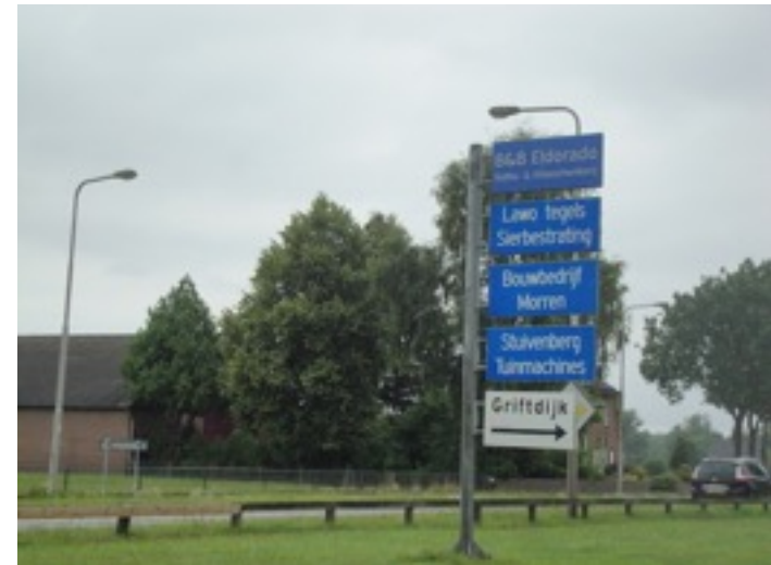
Boven: Bedrijvigheid op de Griftdijk Onder: bestaande recreatieve route rond het noorden.

Gebieden in de kernrand zijn zeer divers, met recreatieve functies, woonfuncties, bedrijfsmatige activiteiten, maneges enz. Vaak zijn deze functies organisch tot stand gekomen. De gemeente wil met deze visie een toetsing kader bieden waaraan toekomstige initiatieven kunnen worden getoetst. De initiatieven dienen in ieder geval ten alle tijde bij te dragen aan de instandhouding of verbetering van het omliggende landschap en waarop beleving en recreatief mede gebruik van dit landschap vanuit de kern kan worden verbeterd.