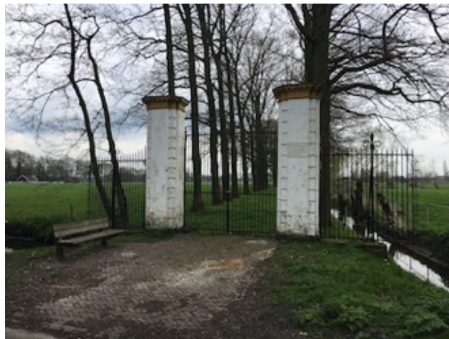
Boven: Hofstad Groenewoud Onder: Toegangspoort Ridderhofstad