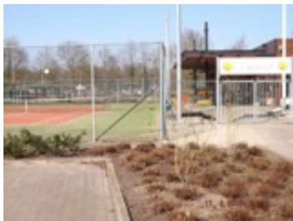
Groene overgang naar het buitengebied

Het achtergelegen fraaie slagenlandschap dat een groot deel van het buitengebied van de gemeente Woudenberg kenmerkt en het landgoed Geerestein, is door de bebouwing vanuit het dorp niet zichtbaar. Ook ontbreekt de mogelijkheid om het buitengebied / landgoed vanuit het noordwestelijke deel van het dorp te bereiken, zodat het gebied nauwelijks voor recreanten bereikbaar is. De sportvelden zorgen daarentegen voor een meer open en groene overgang tussen de kern en het buitengebied. Hier is wel een verbinding naar de Griftdijk maar niet naar het landgoed.