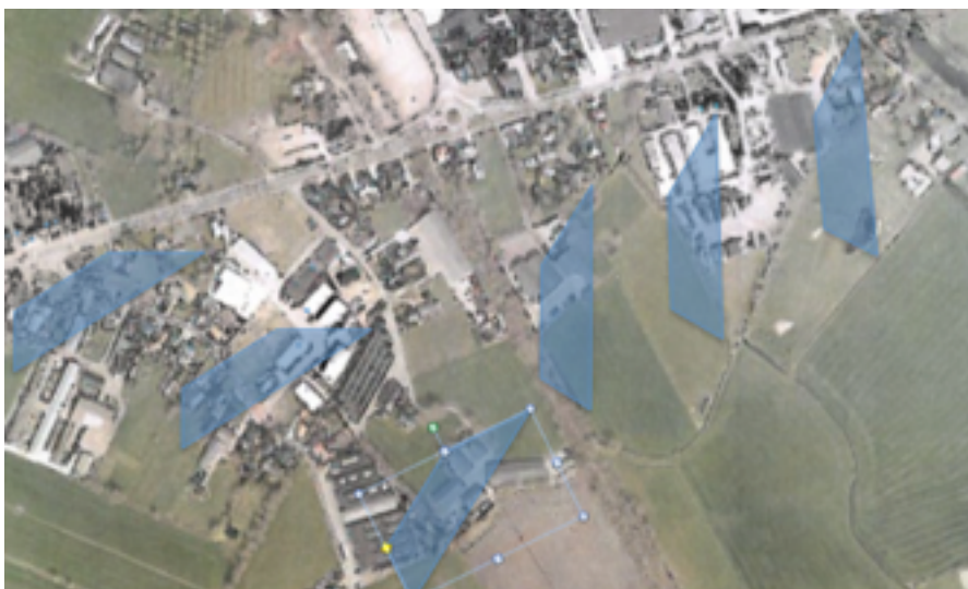
Boven: het plangebied

Woonbebouwing komt ook voor langs de Laagerfseweg. Veelal gaat het hier om bebouwing uit de jaren zestig met vrijstaande of twee onder een kap woningen. De woningen bevinden zich veelal op ruime en diepe kavels die direct grenzen aan het buitengebied. In de loop van de tijd heeft zich op een aantal percelen kleinschalige vormen van bedrijvigheid ontwikkeld. Vanuit het buitengebied is de bedrijfsbebouwing langs Stationsweg Oost en de Laagerfseweg heel goed waarneembaar en vormt daarmee een minder fraaie en harde overgang