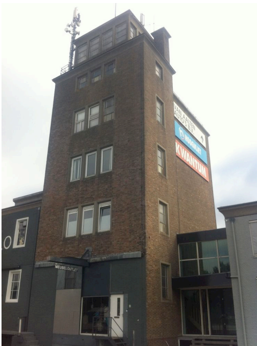
Foto 3 De meubeloutlet langs de Parallellweg.

Het is niet uit te sluiten dat er verblijfplaatsen voorkomen. Langs de Zegheweg is een boom aangetroffen met meerdere holtes, ook langs de spoorzone en het Valleikanaal komen dikke bomen voor die voor vleermuizen geschikte holtes kunnen bevatten. De NDFF maakt melding van baardvleermuis (2010), franjestaart (2011) en gewone grootoorvleermuis (208 t/m 2011) die in een of meer winterverblijfplaatsen zijn aangetroffen. Op basis van de gegevens is onduidelijk waar deze zich bevinden. De loodsen en andere bedrijfsgebouwen lijken weinig mogelijkheden voor verblijfplaatsen te hebben. Er liggen ook enkele uit baksteen opgetrokken gebouwen, die (in potentie) wel geschikt zijn als verblijfplaats. Een voorbeeld is de meubeloutlet aan het zuiden van de Parallellweg (foto 3).