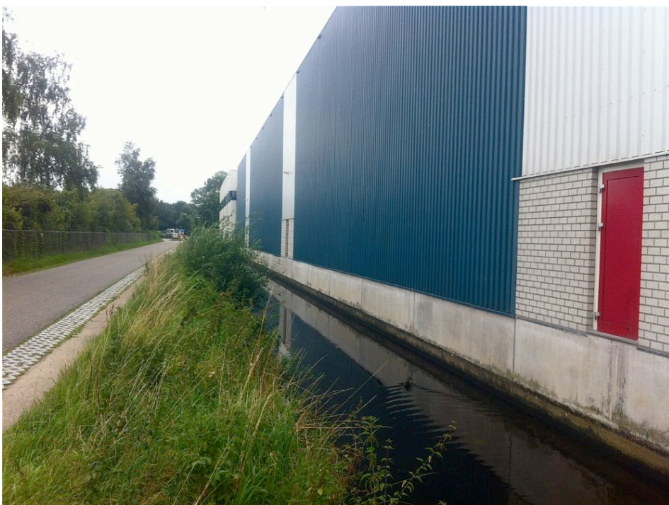
Foto 2 Afwateringsloot langs De Nort, noordkant.