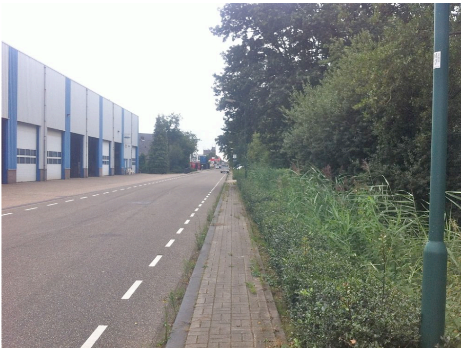
Foto 1 De Parallelweg langs de spoorzone heeft veel opgaand groen.