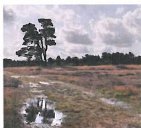
Heidestein heide en dennenbos