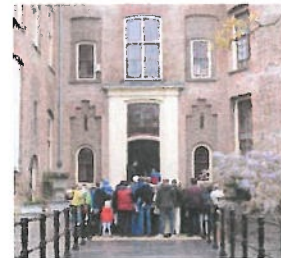
Loenersloot restauratie kasteel