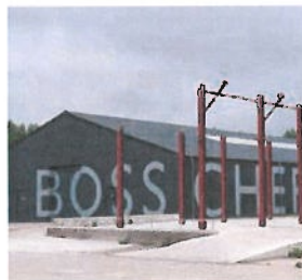
Boscherwaarden nieuwe functie steenfabriek