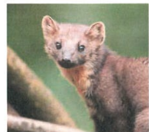
Amerongse Bos loofbos en natuurakkers