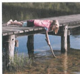
Stoutenburg landgoedbos en graslanden