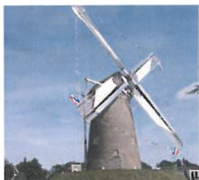
Molen Maallust ruimte om te draaien in Amerongen