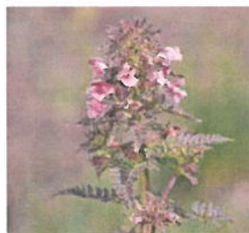
Bolgerijen-Autena graslanden en grienden