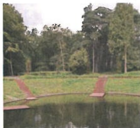
Beerschoten modern herstel historische Goudvissenkom