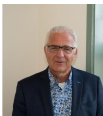
P. van Schaik