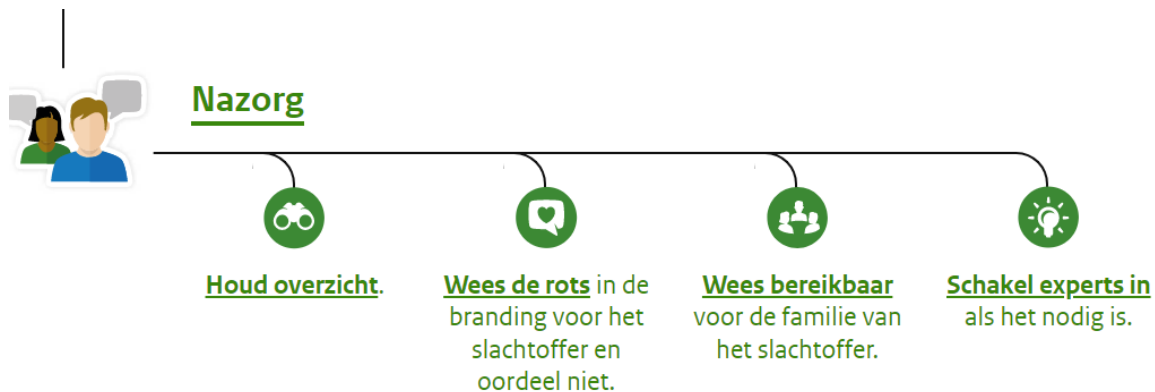
Afbeelding 4. Stroomschema 'Nazorg' 5

In de meeste gevallen volstaat een gecombineerd incident- en herstelgesprek. Indien een gesprek met de pleger wordt georganiseerd, wordt het gedrag besproken en wordt expliciet benoemd dat het gedrag ontoelaatbaar is. Eveneens wordt met elkaar getoetst of het contact weer op de normale wijze, zonder beperkende maatregelen en/of contactafspraken, hervat kan worden. Het waarborgen van de veiligheid van de politieke ambtsdragers is hierbij bepalend.