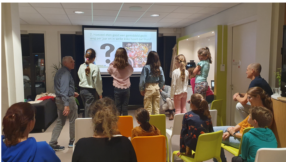
Sfeerimpressie activiteit in Huiskamer

In de week van dinsdag 10 t/m vrijdag 13 oktober 2023 is de 7e editie van WAUW!denberg georganiseerd rond het thema Circulariteit, het nieuwe normaal. Na enige twijfel en door wisseling van de duurzaamheidsmedewerkers binnen de gemeente heeft het geslonken projectteam toch een programma samengesteld. Met in totaal 6 programma-onderdelen. Tijdens de WAUW-week werden Woudenbergers geïnformeerd over praktische duurzaamheidsonderwerpen dicht bij huis. In de bijlage is te zien uit welke programmaonderdelen deze editie bestond. WAUW!denberg vond grotendeels plaats in het Cultuurhuis en kwam tot stand in samenwerking met Gemeente Woudenberg, Stichting Duurzaam Woudenberg en het Huiskamercafé van het Cultuurhuis. De programmacoördinator van het Cultuurhuis heeft extra uren aan de gemeente gedeclareerd voor de projectcoördinatie van WAUW!denberg.