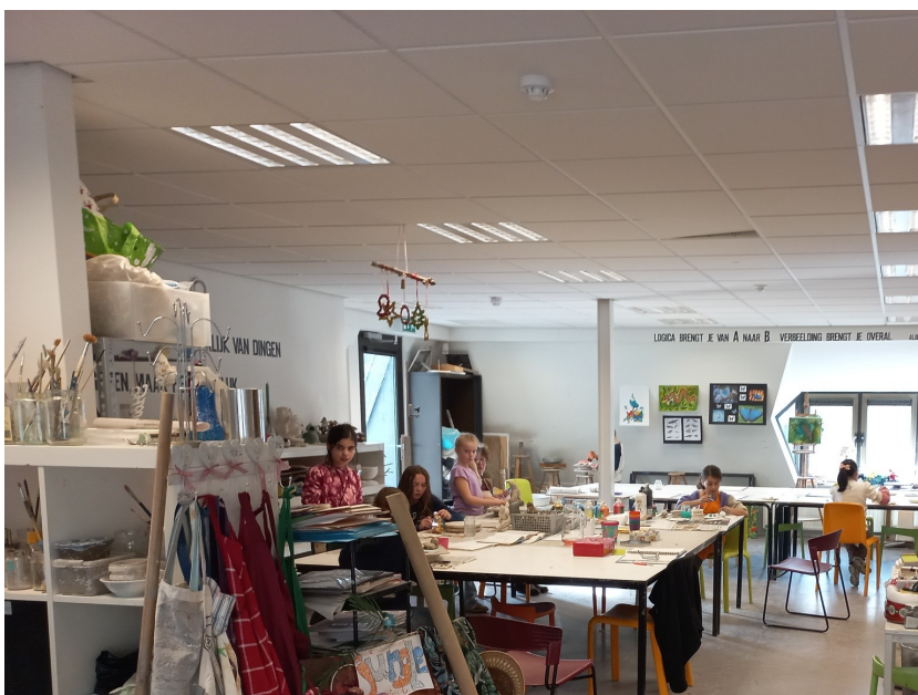
Impressie werkatelier KCW

Besluiten zijn genomen over de jaarrekening 2022, alsmede de begroting 2024 en de benoeming van het bestuurslid namens de Bibliotheek.