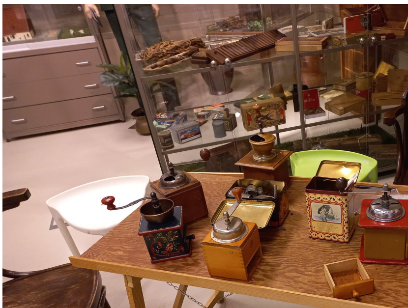
Schoolklassen op bezoek bij Oud Woudenberg

Iedere maand is er een nieuw aanbod van zelfgemaakte spullen door creatieve makers uit Woudenberg. Tijdens de maandelijkse inricht-ochtend ontmoeten de makers elkaar en bespreken ze allerhande Hip&Handgemaakt zaken. In het voorjaar en in het najaar zijn er gezellige laagdrempelige markten geweest. Ook gaven een aantal makers van Hip&Handgemaakt regelmatig workshops voor kinderen en volwassenen in het Huiskamerprogramma.