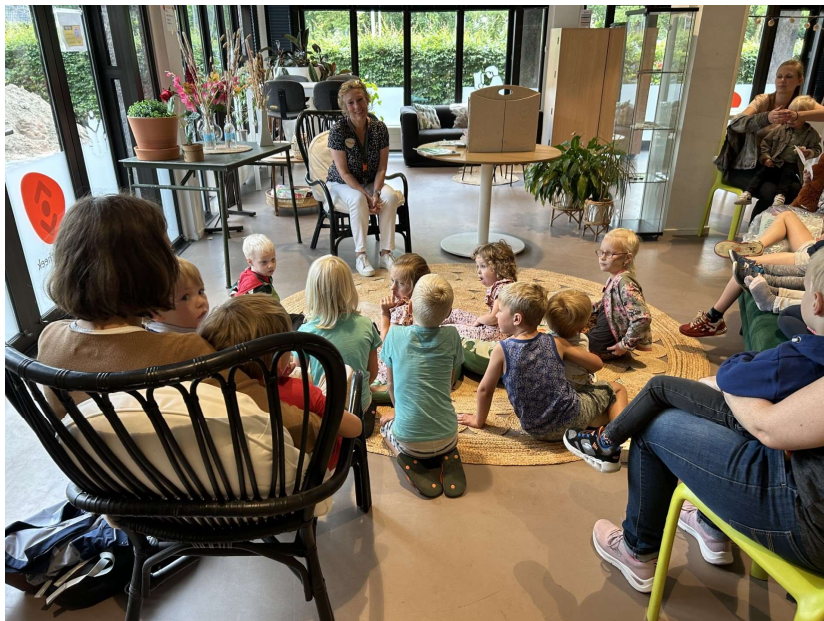
Kinderactiviteit in Huiskamer