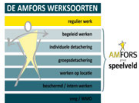
Figuur 1: Werksoorten

Arbeidsinventarisatie en -ontwikkeling – De focus van Amfors ligt voornamelijk op het realiseren en behouden van een duurzame arbeidsplek voor de Sw-medewerkers. Amfors voert hiervoor ontwikkelgesprekken met de medewerkers. Deze ontwikkelgesprekken geven inzicht in de individuele mogelijkheden en beperkingen met als doel de medewerkers een zo passend mogelijke duurzame werkplek te bieden. Amfors biedt daarbij diverse opleidingen en trainingen zoals: Werk je fit, Fluitend naar je werk, Omgaan met Geld. Ook op het gebied van taalvaardigheid geeft Amfors met regelmaat cursussen Nederlandse taal. Daarnaast volgen diverse medewerkers de verplichte opleidingen in het kader van veiligheid.