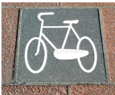
Voorbeeld van een fietssymbooltegel

Het plaatsen van een vijftal fietssymbooltegels zorgt ervoor dat het fietspad duidelijker wordt, voor zowel fietsers alsmede andere verkeersdeelnemers. Daarnaast wordt het nog duidelijker dat parkeren en laden/lossen op het fietspad, niet is toegestaan.