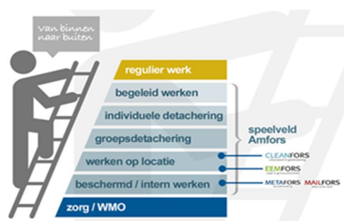
figuur 1: werkladder

• Mobiliteit – In de stappen naar hogere treden op de werkladder (figuur 1) en een plek dicht bij de reguliere arbeidsmarkt is de ontwikkeling van arbeidsvaardigheden essentieel. In het kader van de ontwikkeling is in 2017 circa 10 procent van de medewerkers (106 SE) van werkplek gewisseld. Zo zijn een aantal groepsdetacheringen omgezet in individuele detacheringen. Hierbij was extra aandacht voor de passende begeleiding van de betrokken medewerkers.