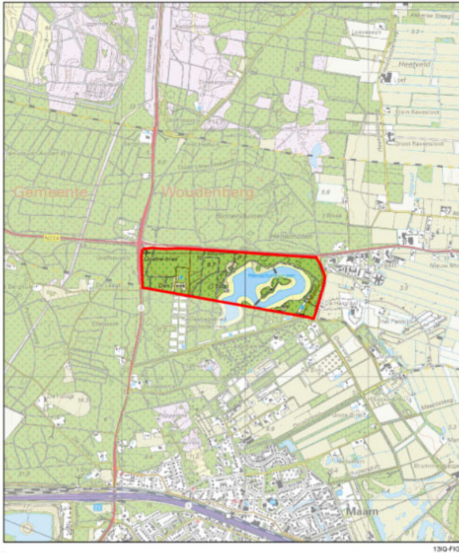
Figuur 1. Ligging plangebied 'Buitengebied, herziening hek Henschotermeer'.