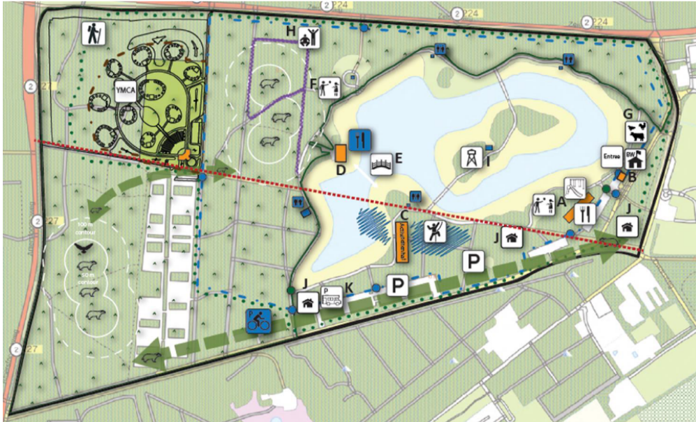
Scenario zoals getoond op 18-06-2019

Naar aanleiding van de presentatie zijn er 14 inspraakformulieren binnengekomen. Er worden zorgen geuit over de verkeersdrukke, entreeheffing, verblijfsrecreatie en natuurwaarden. Verder zaten er ook zeer positieve reacties bij. Alle reacties zijn schriftelijk beantwoord.