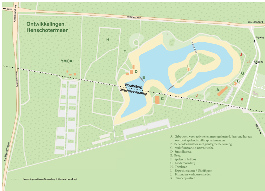
Uitsnede van de gepresenteerde plannen 02-12-2021

De reacties waren over het algemeen positief. Men was blij te zien dat er iets gedaan was met de ophaalde informatie uit de eerdere bijeenkomsten. Ook werd er aangegeven dat men blij was met de stappen die nu al gezet waren om de locatie aantrekkelijker te maken (wegwerken achterstallig onderhoud) Zorgen waren er op het vlak van natuur.