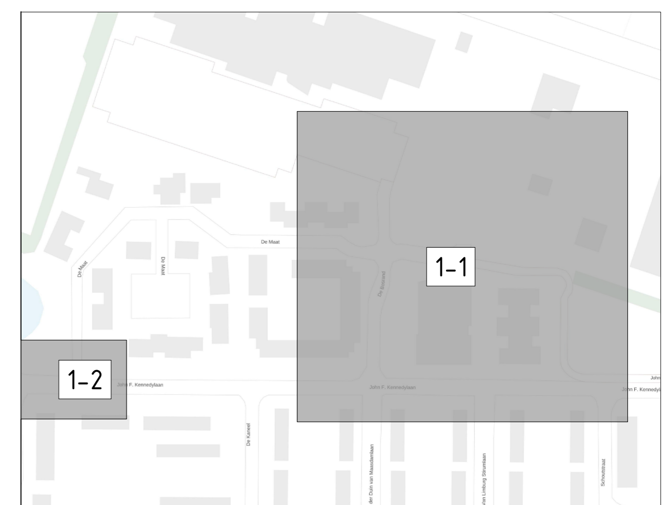
Overzichtkaart SCHAAL 1:5000